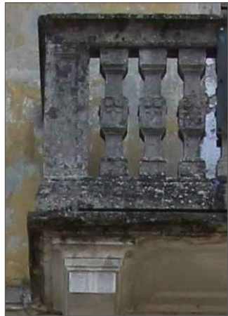
dettaglio parapetto balcone

numerazione di riferimento alle immagini fotografiche